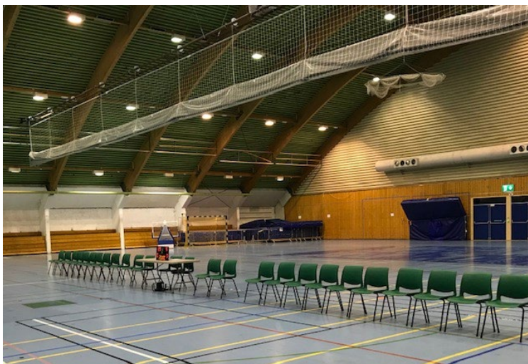
Bilder av et sett til Sekretariatet. Plasseres ved sidelinja midt på hver av banene.