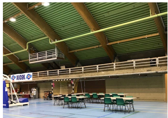
Bilder av rigget kiosk og kafeområde